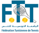
TABLEAU FINAL P1000 FEMMES